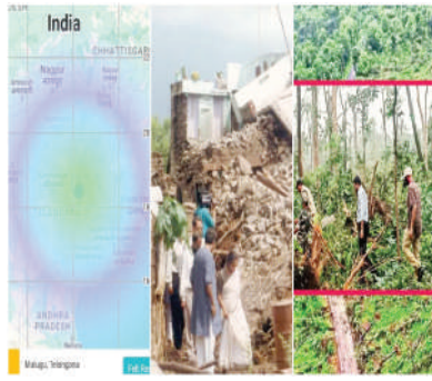
ఆయన ఆ ట్వీట్లో కోరారు. గోదావరి నది సమీపంలో ఉన్న ఈ అటవీ ప్రాంతంపై ప్రకృతి ప్రభావం ఎలా ఉందో తాల్పేటలు అంచనా వేస్తున్నారు. నదీ పరివాహక ప్రాంతానికి సమీపంలోనే బొగ్గు గనులు కూడా ఉన్నాయి. దీంతో భూగర్భ నిపుణులు ఈ ప్రాంత సెసిమిక్ యాక్టివిటీపై లోతుగా అధ్యయనం చేయాల్సి ఉంటుందని అంచనా వేస్తున్నారు.

అటవీ అధికారులు ఇటీవల అంచనా వేశారు. ఆ నాటి భారీ వర్షానికి బలమైన గాలులు తోడు కావడంతో తాదావులు, ఏటానుకాగం, గోవిందరావుపేట మండలాల్లోని అడవులకు తీవ్ర నష్టం కలిగింది. 332.02 హెక్టార్లలో 85,125 చెట్లు కూలిపోవడమో, విరిగిపోవడమో జరిగిందని అధికారులు డ్రోన్ ఫోటోలు, వీడియోల ద్వారా అంచనా వేశారు. ములుగు జిల్లాలో జరిగిన ప్రకృతి విపత్తుపై బీఆర్ఎస్ వర్కింగ్ ప్రెసిడెంట్ కేటీఆర్ సెప్టెంబర్ 11వ తేదీన తన ట్వీట్లలో అకౌంట్లో ఓ వీడియోను పోస్టు చేశారు. సుమారు లక్షకుపైగా చెట్లు మేడారం అడవుల్లో కూలాయని, వాతావరణ మార్పులు, పర్యావరణ సమస్యలను పరిష్కరించుకోవాల్సిన అవసరం ఉందని ఆ ట్వీట్లో ఆయన తెలిపారు. ప్రకృతి విపత్తులను అడ్డుకోవాలంటే కలిసికట్టుగా పర్యావరణ సంరక్షణ చేపట్టాలని