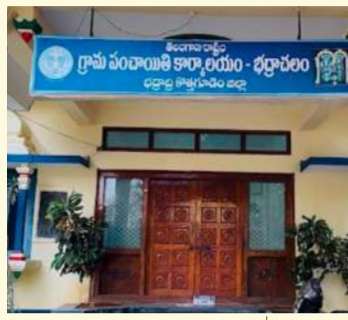
భద్రాద్రి కొత్తగూడెం ప్రతినీధి (నినాదం):

"పంచాయతీ ఎన్నికల ప్రక్రియ మొదలైంది. ఒకవైపు ఓటర్ల జాబితా తయారు, పోలింగ్ స్టేషన్లపై రాజకీయ పార్టీల సలహాలు తదితర వస్తుల్లో అధికారులు నిమగ్నమైనారు. మరోవైపు సర్పంచ్, వార్డుమెంబర్ పదవులు ఆశిస్తున్న వారు తమకే మద్దతు ఇవ్వాలని మండల నాయకుల ఇళ్ళ మట్టు ప్రదక్షిణలు మొదలుపెట్టారు."