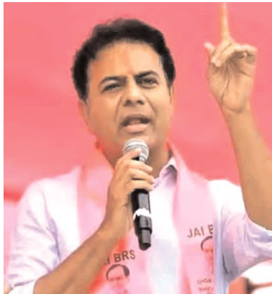
అమృతదీని ఆగం చేశారని దుయ్యబట్టారు.

హైదరాబాద్, డిసెంబర్ 10 (నినాదం న్యూస్) : కాంగ్రెస్ పార్టీ ఎలాగైనా అధికారంలోకి రావాలని ఇష్టంవచ్చినట్లు హామీలు ఇచ్చి ఇప్పుడు అమలు చేయటానికి నానా కారణాలు చెబుతుందని మాజీ మంత్రి కేటీఆర్ ఆరోపించారు. ఇది ప్రజా పాలన కాదు.. ప్రజా పీడిత పాలన అని మాజీ మంత్రి కేటీఆర్ మండిపడ్డారు. కాంగ్రెస్ ఏదాది పాలనలో ప్రజల వేదన అరణ్య రోదనగానే మిగిలిందని విమర్శించారు. రైతులను చెరబట్టారని, పేదల ఇండ్లు కూలగొట్టారని ధ్వజమెత్తారు. రైతుబంధు ఎత్తేశారని, రైతుబీమాకు పాతకేశారని, కేసీఆర్ కిట్, న్యూట్రిషన్ కిట్ మాయం చేశారని,