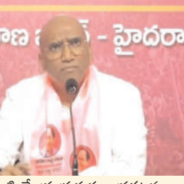
9న నాటి కేంద్ర ప్రభుత్వం ప్రకటన

ప్రసంగంలో కేసీఆర్ వీరోచిత పోరాట ప్రస్థావనే లేకపోవడం, సంకుచిత మనస్తత్వానికి అద్దం పడుతున్నది. మీరు ఈరోజు ఆంధ్ర పాలకుల స్పృష్టను తప్పులేకుండా చదివినది ఎవరికైనా ఇట్టే తెలిసిపోతుంది అని ఆర్ఎస్ ప్రవీణ్ కుమార్ పేర్కొన్నారు. సూటిగా చెప్పండి.. నవంబర్ 29న కేసీఆర్ ప్రాణ త్యాగానికి సిద్ధం కాకపోతే డిసెంబర్