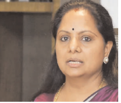
తెలంగాణ తల్లి రూపురేఖలను మార్చడాన్ని తీవ్రంగా ఖండిస్తున్నామన్నారు. బతుకమ్మతో

తెలంగాణ తల్లి రూపురేఖల్ని మార్చి ముఖ్యమంత్రి రేవంత్ రెడ్డి ఆవిష్కరించడం దురదృష్టకరమన్నారు. రేవంత్ రెడ్డి ప్రభుత్వ దుశ్చర్యకు తెలంగాణ తల్లి కన్నీళ్లు పెడుతుందని తెలిపారు. ఉద్యమ తల్లిని నేడు కాంగ్రెస్ తల్లిగా మార్చారని విమర్శించారు. రాజీవ్ గాంధీ విగ్రహాన్ని రహదారిలో ఏర్పాటు చేసి.. తెలంగాణ తల్లి అని చెబుతున్న విగ్రహాన్ని చెరసాలలో ఏర్పాటు చేస్తున్నారని దుయ్యబట్టారు. కాంగ్రెస్ తల్లిని తాము తిరస్కరిస్తున్నామని వెల్లడించారు. కోట్లాది మంది తెలంగాణ బిడ్డల్లో స్ఫూర్తి నింపిన