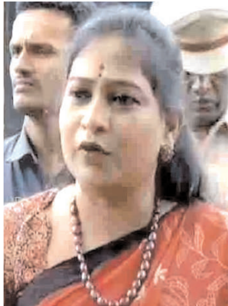
కల్యాణ్ కు.. తమకు మధ్య చిచ్చుపెట్టాలని ప్రయత్నించినా.. ఏం చేసినా.. 'నిన్ను మాత్రం వదిలిపెట్టేదేదని' హోంమంత్రి హెచ్చరించారు. విజయసాయి రెడ్డి ఎంతమంది వద్దకు వెళ్లి ఎన్ని రకాలుగా మాట్లాడినా, తన గురించి విమర్శలు

- వచ్చే ఎన్నికల్లో వైసీపీకి 11 సీట్లు కూడా రావు : హోంమంత్రి వంగలపూడి అనిత విజయవాడ, డిసెంబర్ 9 (నినాదం న్యూస్) : వచ్చే ఎన్నికల్లో వైసీపీకి ఇప్పుడొచ్చిన 11 సీట్లు కూడా రావని హోంమంత్రి వంగలపూడి అనిత అన్నారు. సోమవారం విజయవాడలోని సబ్ జైల్ ను పరిశీలించారు. అక్కడ పరిస్థితులు ఎలా ఉన్నాయో తెలుసుకోవడానికి రావడం జరిగిందని, మౌలిక వసతులపై ఆరా తీశామని, జైలులో అధికారులపై వస్తున్న ఆరోపణలపై తనిఖీ చేయడం జరిగిందని ఆమె అన్నారు. జైలు అధికారులపై వచ్చిన ఆరోపణలపై విచారణ జరుగుతోందని, రెండు రోజుల్లో నివేదిక వస్తుందని త్వరలో చర్యలు తీసుకుంటామని స్పష్టం చేశారు. ఈ సందర్భంగా విజయవాడలో హోంమంత్రి మీడియాతో మాట్లాడుతూ.. తప్పులు బయటపడుతున్నాయని వైఎస్సార్ సీపీ ఎంపీ విజయసాయి రెడ్డి ఇష్టానుసారంగా మాట్లాడుతున్నారని ఆగ్రహం వ్యక్తం చేశారు. విజయసాయి తన స్థాయి.. వయసును మరిచిపోయి నోటికొచ్చినట్లు చిల్లరగా మాట్లాడుతున్నారని.. ఇది మంచి పద్ధతి కాదని.. ఆయన విజ్ఞతకే వదిలివేస్తున్నామని అన్నారు. విజయసాయి ఎన్ని రకాలుగా సీఎం చంద్రబాబును తిట్టినా.. బురద జల్లినా.. పవన్