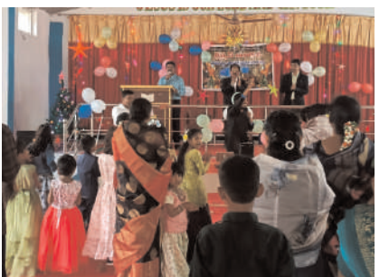
గ్రామాల్లో క్రిస్మస్ వేడుకలు భక్తిశ్రద్ధలతో ఘనంగా నిర్వహించారు.