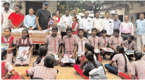
ఉద్దేశ్యంతో ప్రతి ఒక్కరూ ఉన్నత చదువులు చదవాలని ప్రభుత్వ