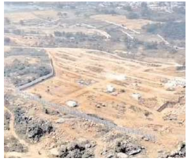
వాదించారు. గజం 100 రూపాయలకే

హైదరాబాద్: బీఆర్ఎస్ పార్టీ కార్యాలయాలకు భూ కేటాయింపులపై బుధవారం హైకోర్టులో విచారణ జరిగింది. పార్టీ కార్యాలయాలకు చౌకగా భూములు ఇచ్చారంటూ దాఖలైన పిటిషన్ పై న్యాయస్థానం విచారణ చేపట్టింది. హైదరాబాద్ తోపాటు మిగతా జిల్లాల్లో బీఆర్ఎస్ పార్టీ కార్యాలయాల కోసం చౌకగా భూములు అమ్మకాలు దక్కించుకున్నారని పిటిషనర్ ప్రస్తావించారు. 500 కోట్లు విలువైన భూమిని కేవలం 5 కోట్లకు కేటాయించారని