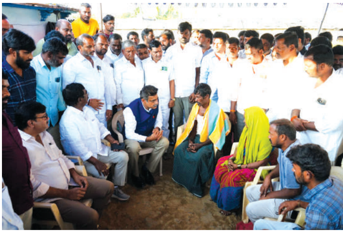
చేవెళ్ల డిసెంబర్ 04 (నినాదం న్యూస్):

హైదరాబాద్ బీజాపూర్ జాతీయ రహదారి- 163 పై సోమవారం ఆలూరు వద్ద జరిగిన రోడ్డు ప్రమాదంలో మృతి చెందిన వారి కుటుంబాలను క్షతగాత్రులను బుధవారం సాయంత్రం చేవెళ్ల పార్లమెంట్ సభ్యులు శ్రీ కొండా విశ్వేశ్వర్ రెడ్డి పరామర్శించారు. ప్రమాదం జరిగిన రోజున ఢిల్లీలో జరుగుతున్న పార్లమెంట్ సమావేశాలలో ఉన్నందువల్ల రాజకీయాలను ఈరోజు కూడా