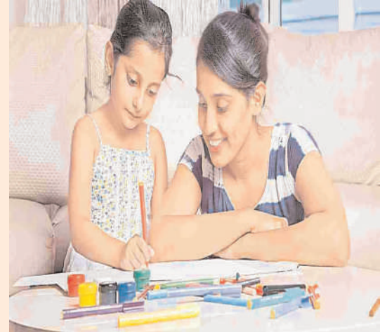
హైదరాబాద్, డిసెంబర్ 4 (నినాదం న్యూస్):

తల్లిదండ్రులకు పిల్లలే సర్వస్వం. అంతులేని ప్రేమాభిమానాలు పంచుతూ ఎంతో అపురూపంగా పెంచుతుంటారు. పిల్లల భవిష్యత్తు గురించే ఆలోచిస్తూ సమయమంతా గడిపేస్తుంటారు. తల్లిదండ్రులకు పిల్లలే సర్వస్వం. అంతులేని ప్రేమాభిమానాలు పంచుతూ ఎంతో అపురూపంగా పెంచుతుంటారు. పిల్లల భవిష్యత్తు గురించే ఆలోచిస్తూ సమయమంతా గడిపేస్తుంటారు. ఈ క్రమంలో పిల్లలకు, తల్లిదండ్రులకు మధ్య ఏర్పడే బంధం పిల్లల మానసిక పరిపక్వతకు, తల్లిదండ్రుల సంతోషానికి దోహదం చేస్తుంది. ఈ ప్రేమ బంధం బలపడేలా తల్లిదండ్రులు పిల్లలతో సరదాగా ఎలా గడపాలో తెలుసుకుందాం!