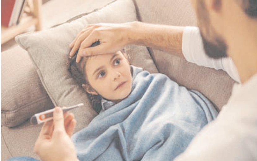
హైదరాబాద్, డిసెంబర్ 4 (నినాదం న్యూస్):

శీతాకాలం (చలికాలం)లో పిల్లల నుంచి పెద్దల వరకూ అందరికీ అనారోగ్య సమస్యలు వస్తూనే ఉంటాయి. ఈ కాలపు వాతావరణం పిల్లల ఆరోగ్యంపై ఎంతో ప్రభావం చూపుతుంది. ముఖ్యంగా ఈ కాలంలోనే పిల్లల రోగ నిరోధక శక్తి క్షీణించి వారి ఆరోగ్యం సన్నగిల్లుతుంది. ఫలితంగా వారు చురుగ్గా కాకుండా నీరసంగా ఉంటారు. అనేక సీజనల్ సమస్యలకు లోనవుతారు. సరైన ఆహారం తీసుకోకపోవడం వల్ల శరీరం బ్యాక్టీరియా, జెమ్మీతో పోరాడే రోగనిరోధక శక్తిని కోల్పోతుంటారు. పిల్లలైనా, పెద్దలైనా చలికాలంలో సరైన డైట్ పాటించడం చాలా ముఖ్యం. అంతేకాక ఆహారపు అలవాట్లలో కొన్ని రకాల మార్పులు చేయటం తప్పనిసరి కూడా. పిల్లలు తీసుకునే ఆహారంలో తగినన్ని పోషకాలు, విటమిన్లు, మినరల్స్ ఉండేలా శ్రద్ధ తీసుకోవాలి. ఆకుకూరలు తినటం ద్వారా అధికమొత్తంలో పోషకాలు, విటమిన్లు ఉంటాయి. పాలకూర, మెంతికూర, ఉల్లికాడలు, తాజా వెల్లుల్లిని పిల్లల ఆహారంలో చేర్చటం వల్ల వారికి ఎక్కువ మొత్తంలో పైటోస్యూట్రియంట్స్, విటమిన్లు, మినరల్స్ను అందించొచ్చు. ఆకుకూరలతోపాటు పప్పు కూడా తినిపిస్తే మరిన్ని ఎక్కువ పోషకాలు శరీరానికి అందుతాయి. ఎక్కువగా దగ్గు, జ్వరం, జలుబు వంటివి వీడిస్తుంటాయి. ఈకాలంలో వైరస్, బ్యాక్టీరియా సులభంగా వ్యాప్తి చెందుతాయి. మరి ముఖ్యంగా చిన్న పిల్లలు జబ్బుల బారిన పడుతుంటారు. రాబోయే మూడు నెలలు చలి తీవ్రత ఎక్కువగా ఉండే అవకాశాలు మెండుగా ఉన్నాయి. ఈ క్రమంలో పిల్లల ఆరోగ్యంపై తల్లిదండ్రులు ప్రధానంగా కేంద్రీకరించాలి. రోగనిరోధక శక్తి తక్కువగా ఉండే పిల్లల ఆరోగ్యంపై ఈ కాలంలో ప్రత్యేక శ్రద్ధ అవసరం. ఈ కాలంలో ఎలాంటి ఆరోగ్య జాగ్రత్తలు తీసుకోవాలో తెలుసుకుందాం. దుస్తులు : పిల్లలను