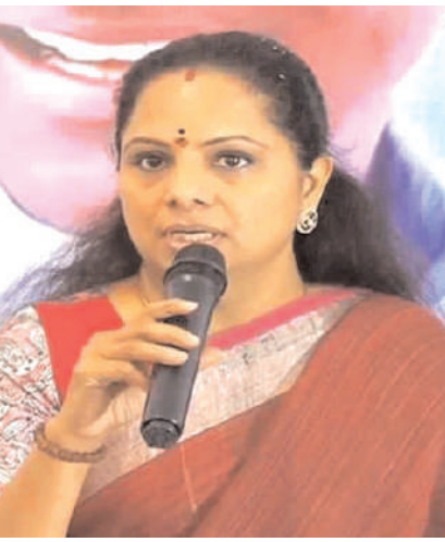
ప్రశ్నించారు. ప్రజలను అవమానించేలా తెలంగాణ తల్లి

హైదరాబాద్, డిసెంబర్ 13 (నినాదం న్యూస్): తెలంగాణ తల్లి రూపాన్ని ఎలా మారుస్తారని బీఆర్ఎస్ ఎమ్మెల్యే కవిత విమర్శించారు. ఉద్యమంలో స్ఫూర్తి నింపిన రూపాన్ని విగ్రహంగా మలుచుకున్నామని చెప్పారు. తెలంగాణ తల్లిపై రేవంత్ రెడ్డి సర్కార్ గెజిట్ ఇవ్వడం దారుణమన్నారు. బ్రిటిష్ ప్రభుత్వం కూడా భరతమాత విగ్రహంపై గెజిట్ ఇవ్వలేదని ఆగ్రహం వ్యక్తం చేశారు. దేశం కోసం ప్రాణత్యాగం చేసిన వారి విగ్రహాలు పెట్టుకున్నామని, జీవో ఇస్తేనే వారి విగ్రహాలు పెడతామా అని