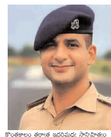
కొంతకాలం తర్వాత ఇద్దరి మధ్య సాన్నిహిత్యం