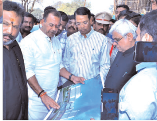
పేషెంట్లు ఎక్కువగా వస్తున్నారు. వందల అంబులెన్స్ క్యూలో నిలబడాల్సిన పరిస్థితి