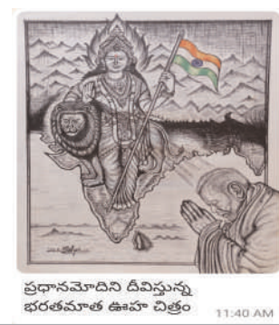
ప్రధానమోదినీ దీవిస్తున్న భారతమాత ఊమా చిత్రం