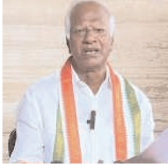
తెలుసు. అలాగే ఫార్ములా ఈ కేసులో రేఫో మాఫో కేసీఆర్ కుమారుడు కేటీఆర్ కూడా జైలుకు వెళ్లబోతున్నారని సంచలన వ్యాఖ్యలు చేశారు కడియం శ్రీహరి. కాళ్ళెక్కరం ప్రాజెక్ట్ విషయంలో కేసీఆర్, హరీష్

జనగాం, జనవరి 2 (నినాదం): మాజీ సీఎం కేసీఆర్ కుటుంబంపై మాజీ మంత్రి, స్పెషల్ ఛీఫ్ పూర్ ఎమ్మెల్యే కడియం శ్రీహరి సంచలన వ్యాఖ్యలు చేశారు. శుక్రవారం ఆయన ఓ కార్యక్రమంలో మాట్లాడుతూ.. బీఆర్ఎస్ అధికారంలో ఉన్న పదేళ్లు కేసీఆర్ కుటుంబం పెద్దఎత్తున తెలంగాణ వనరులను కొల్లగొట్టి అవినీతికి పాల్పడిందని ఆరోపించారు. నీతివంతులం.. నిజాయితీపరులమని మాట్లాడుతున్న వీరీ కుటుంబంపై ఎందుకు ఆరోపణలు వస్తున్నాయని నిలదీశారు. కేసీఆర్ కూతురు ఎమ్మెల్యే కవిత లిక్కర్ కేసులో ఇరుక్కొని తీహార్ జైలులో ఎన్ని రోజులు ఉందో రాష్ట్ర ప్రజలందరికీ తెలుసు. అలాగే ఫార్ములా ఈ కేసులో రేఫో మాఫో కేసీఆర్ కుమారుడు కేటీఆర్ కూడా జైలుకు వెళ్లబోతున్నారని సంచలన వ్యాఖ్యలు చేశారు కడియం శ్రీహరి. కాళ్ళెక్కరం ప్రాజెక్ట్ విషయంలో కేసీఆర్, హరీష్