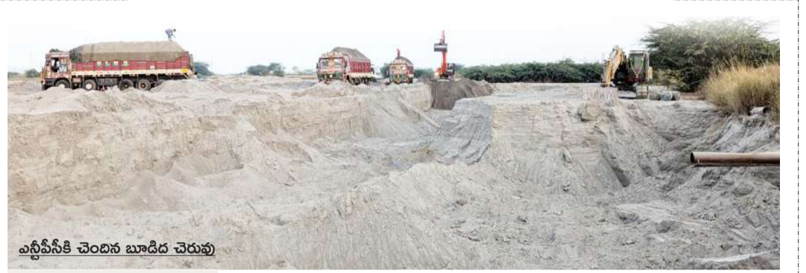
ఎన్టీపీసీకి చెందిన బూడిద చెరువు

డిల్లీ బీజేపీ శాసనసభాపక్ష సమావేశం వాయిదా పడింది. సోమవారం జరగాల్సిన బీజేపీ సమావేశాన్ని అధిష్టానం ఫిబ్రవరి 19 వతేదీ మంగళవారానికి వాయిదా వేసింది.