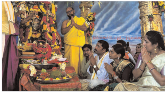
కట్టుదిట్టమైన భక్తుల పాల్గొంటూ మహాశివరాత్రి వేడుకలు వైభవంగా కొనసాగుతున్నాయి. ఈ కార్యక్రమంలో మహిళలు, భక్తులు, పెద్ద ఎత్తున పాల్గొన్నారు.