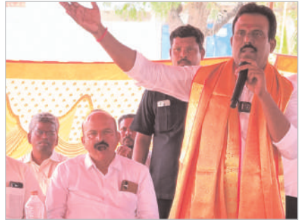
కాంగ్రెస్ ప్రభుత్వం ఇచ్చిన పోషిలు నెరవేరుస్తూ ఇందిరమ్మ ఇండ్లు, రిఫస్ కార్డులతో పాటు 78 లక్షల నిధులతో గ్రామంలో అభివృద్ధి కార్యక్రమాలకు శంకుస్థాపన చేసుకున్నామని తెలియజేశారు. అనంతరం పలు గ్రామాలలో అభివృద్ధి కార్యక్రమాలను ప్రారంభించారు.