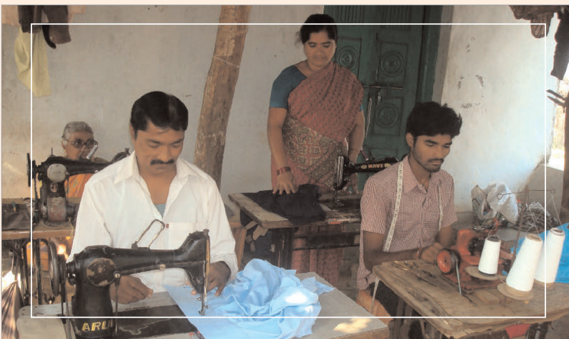
నర్సినయోగం చేసుకోలేని చాలా మంది వెనుకబడి పోయారు. కొంత మంది ఈ పరిస్థితిని అందుకో గలిగినా తగినంత పెట్టుబడి లేక చితికిపోయారు. ప్రత్యామ్నాయ

అతుకుల బతుకులు ఆగం.. వన జీవనం నుంచి జనజీవనం వైపు మనిషిని నడిపించి, పరుగు తీయించిన ప్రస్థానంలో దర్జీల పాత్ర విశేషమైనది. ప్రస్తుతం దర్జీలవి అతుకుల బతుకులయ్యాయి. కొన్నేళ్ల క్రితం వరకూ ప్రతి ఊరిలో ప్రత్యేక వీధిలో కుట్టుమిషన్ చప్పుడు వినిపించేది. ప్రస్తుతం ఆ చప్పుడు లేదు. నాగరిక సమాజం వైపు ప్రపంచీకరణలో భాగంగా మానవ జీవితంలోకి దూసుకువచ్చిన యాంత్రిక పరికరాలు మేర కులస్తుల ఉపాధిని కూల్చాయి. మర్రి నేషనల్ కంపెనీలు రెడీమేడ్ దుస్తుల వ్యాపారంలోకి ప్రవేశించి మార్కెట్ను ఆక్రమించడంతో సామాన్యులు కూడా ఆ బట్టలు కొనుగోలు చేస్తుండడంతో మేరోళ్ల బతుకులు ఆగమవుతున్నాయి. వ్యతిరేకమైన సవ్యత, ఆధునిక యంత్రాలను