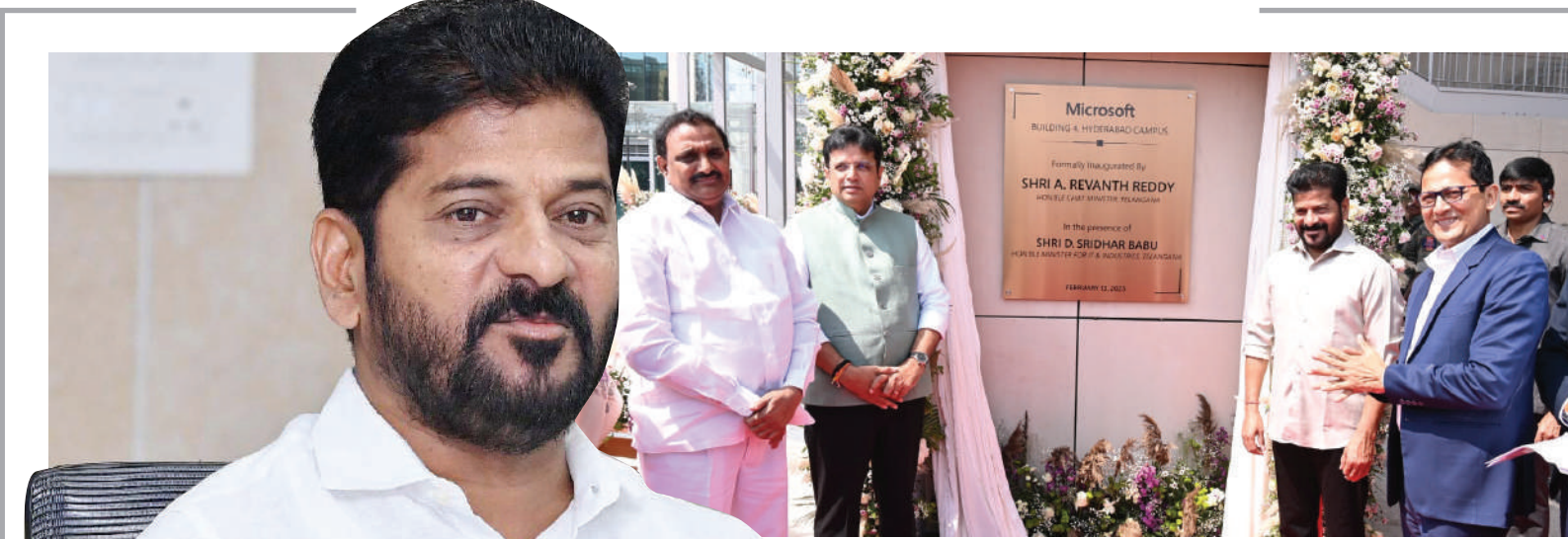
హైదరాబాద్, ఫిబ్రవరి 13 (నినాదం న్యూస్) :