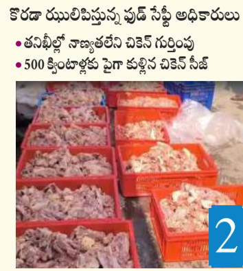
కొరడా రుమలిపిస్తున్న ఫుడ్ సేఫ్టీ అధికారులు... తనిఖీల్లో నాణ్యతలేని చికెన్ గుర్తింపు... 500 కిలోలకు పైగా కుళ్లిన చికెన్ సీజ్