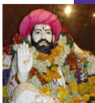
బంజారాల సంత సేవాలాల్ మహారాజ్ జీవితాల్లో దైవంగా పూజిస్తారు... పూర్తిగా శాఖాపాలి ఐన ఆయన మనుష్యులందరూ ప్రేమ, దయ, కరుణ కలిగి ఉండాలని బోధించారు. బంజారాల జీవితాల్లో సుఖ సంతోషాలు నింపేందుకు కృషి చేశారు.

సంస్కృతి సంప్రదాయాలకు పెద్దపీట... రాష్ట్ర వ్యాప్తంగా వేడుకలకు సర్కార్ శ్రీకారం... నాలుగో ఘనంగా మేడుకలు... నేడు సేవాలాల్ మహారాజ్ జయంతి