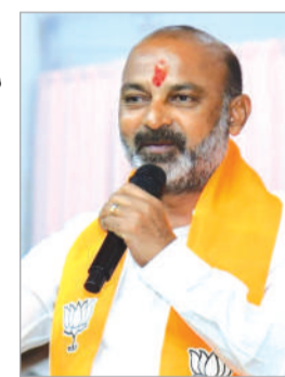
ఎదిరించిన వీరుడు శివాజీ. తల్లి జిజియా బాయి, గురువు బాబులో నడిచిన శివాజీ హిందూ ధర్మ రక్షణ కోసం తన చివరి శ్వాస వరకు పోరాడారు...