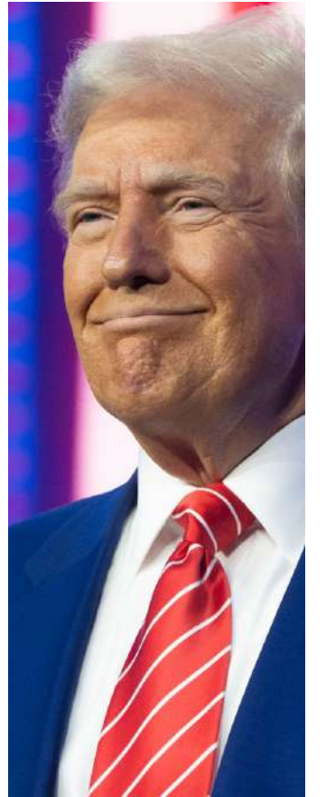
భారత్ వ్యతిరేకిస్తుందని అన్నారు. మన పౌరుల్లో ఎవరైనా అమెరికాలో పట్టమిర్చుతూ నివసిస్తున్నట్లుంటే, వారు భారతీయ పౌరులు అయితే, స్వదేశానికి చట్టబద్ధంగా తిరిగి రావడానికి సిద్ధంగా ఉన్నామని కేంద్ర మంత్రి ఎన్ జైశంకర్ అన్నారు.

వెతికి పట్టుకుని మరి దేశం దాటిస్తున్న ట్రంప్ మిలిటరీ విమానంలో పలువురు భారతీయుల తరలింపు