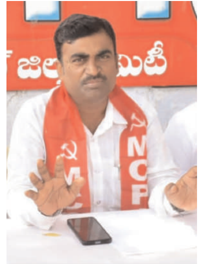
8న కమ్యూనిస్టు కోఆర్డినేషన్ కమిటీ పిలుపుమేరకు ఎంసిపిఐ(యు) ఆధ్వర్యంలో జిల్లావ్యాప్తంగా కేంద్ర ప్రభుత్వ దిష్టిబొమ్మల రహనం నిరసన కార్యక్రమాలను జయప్రదం చేయాలని కోరారు.

వర్గాల పాలకులుగా నిరూపించుకున్నారని ఆవేదన వ్యక్తం చేశారు. దేశానికి వెన్నెముక అయిన వ్యవసాయ రంగాన్ని సంక్షోభం నుంచి గట్టెక్కించేందుకు నిధులు పెంచాలింది పోయి సబ్సిడీలు తగ్గించారన్నారు. జాతీయ గ్రామీణ ఉపాధి హామీ పథకం ద్వారా కూలీలకు ఉపాధి దొరకకుండా బడ్జెట్ లో కోత విధించారని పంటల ధరల నియంత్రణకు బడ్జెట్ కేటాయింపులే లేవని ఈ బడ్జెట్ పేదలపై భారాలు - కార్పొరేట్ శక్తులకు వరాలు అన్న మాదిరిగా ఉందన్నారు. ఇంకొక వైపు తెలంగాణ రాష్ట్రానికి ఏ విధమైన బడ్జెట్ కేటాయింపులు లేకుండా తీరని అన్యాయానికి వివక్షతకు గురి చేశారన్నారు. రాష్ట్రంలో 8 మంది బీజేపీ ఎంపీలు ఇద్దరు కేంద్ర మంత్రులు ఉన్న ఒరిగింది శూన్యమని గత ఎన్నికల్లో ఇచ్చిన ఏ ఒక్క హామీని పరిపూర్ణంగా అమలు చేసే విధంగా బడ్జెట్ లేదన్నారు. కేంద్ర ప్రభుత్వంపై ఒత్తిడి తెచ్చి రాష్ట్ర అభివృద్ధికి వివిధ తరగతులు వర్గాల అభ్యున్నతికి ప్రాధాన్యత ప్రకారం నిధులు కేటాయించే విధంగా పోరాడాలన్నారు. ఈ క్రమంలో ఈనెల