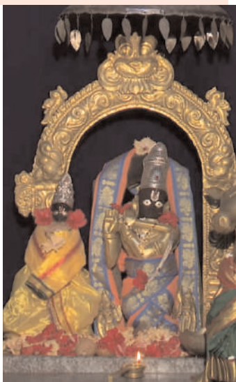
పోయి, తన దుస్థితిని శ్రీహరికి విన్నవించు కోగా, విష్ణుమూర్తి గంగాదేవిని కాకి

కాకర పర్తి గ్రామంలో బయటపడిన శ్రీవేణుగోపాల స్వామిని హంసల దీవికి తెచ్చి ప్రతిష్ఠించారు. అయితే ప్రపంచంలో ఎక్కడా కనిపించని విధంగా ఈ విగ్రహం నీలమేఘ ఛాయలో ఉండడం విశేషం. దేవాలయ కుడ్యాలపై అందంగా చెక్కిన రామాయణ సంబంధ ఘట్టాలు భక్తులను ఆకట్టు కుంటాయి. కళ్యాణోత్సవం ముందు రోజు ఉదయం స్వామి వారిని శాస్త్రోక్త పద్ధతిలో పెళ్ళి కుమారుని చేసి ప్రత్యేక పూజలు నిర్వహించి, తెల్ల వారి ఉదయం శ్రీ రాజ్యలక్ష్మి అమ్మ వారికి కుంకుమ పూజను, రాత్రికి స్వామి వారి కళ్యాణం నిర్వహిస్తారు. పౌర్ణమినాడు రథోత్సవం మరునాడు చక్రస్నానం ఆదిగా సంప్రదాయ కార్యక్రమాలు నిర్వహించడం ఆనవాయితీగా వస్తున్నది