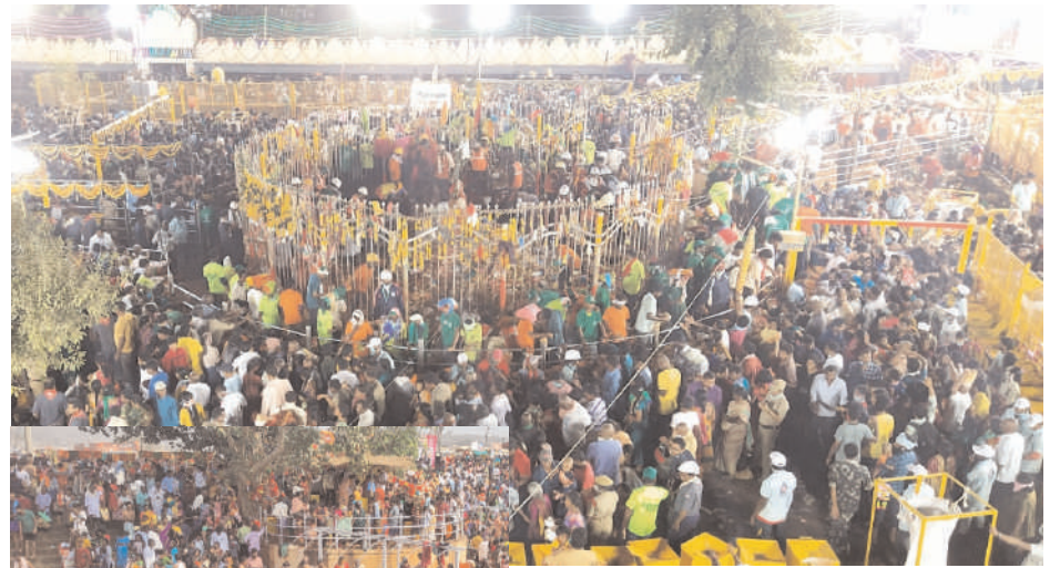
మధ్యప్రదేశ్, తెలంగాణ, ఆంధ్రప్రదేశ్ తదితర రాష్ట్రాల నుంచి భక్తులు భారీ సంఖ్యలో హాజరుకానున్నారు.

భక్తుల కొంగు బంగారం శ్రీ సమృక్త సారలమ్మ కొలువుదీరిన మేడారం మినీ జాతరకు భక్తుల తాడికి మొదలైంది. ఈ జాతరకు సుమారు 20 లక్షల మందికి