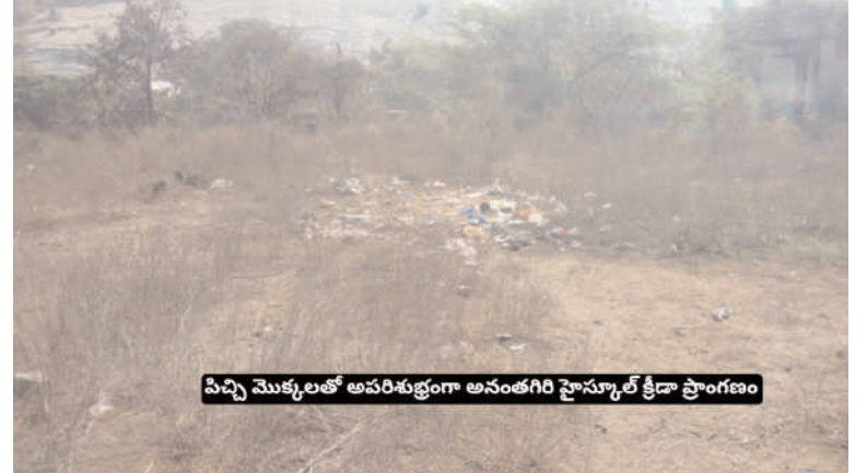
పిచ్చి మొక్కలతో అసరిశుభ్రంగా అనంతగిరి హైస్కూల్ క్రీడా ప్రాంగణం

ఇందుకు ఉదాహరణ కోదాడ పట్టణంలోని బాయ్స్ స్కూల్. ఈ పాఠశాలలో నిత్యం సాయంత్రం సమయంలో విద్యార్థులు క్రీడలను ఆడుతూ వారి నైపుణ్యాన్ని పెంపొందించుకుని అనేకమంది జిల్లా రాష్ట్ర జాతీయ స్థాయిలో ఉత్తమ ప్రతిభను కనబరిచారు. కానీ పట్టణంలో ఉన్న శ్రద్ధ గ్రామీణ ప్రాంతాలలోని పాఠశాలలో ఉపాధ్యాయులు కనబరచడం లేదు. అనంతగిరి మండల వ్యాప్తంగా ఇదే పరిస్థితి కనిపిస్తుంది. విద్యార్థులకు క్రీడలు నేర్పిస్తున్న దాఖలలు ఎక్కడా కనిపించడం లేదు. దీంతో పాఠశాలలో ప్రభుత్వం విద్యార్థులకు కోసం ఏర్పాటు చేసిన క్రీడా ప్రాంగణాలు అధికారులు పట్టించుకోకపోవడంతో పిచ్చి చెట్లు పెరిగి అడవిని తలపిస్తున్నాయి.