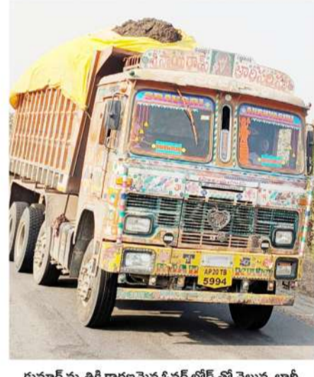
కుమార్ మృతికి కారణమైన ఓటర్ లోడ్ తో బెల్టున్న లారీ