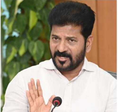
శనివారం మాట్లాడకపోయినా.. శనివారం 2లో

మాజీ ముఖ్యమంత్రి, బీఆర్ఎస్ అధినేత కేసీఆర్ కు ముఖ్యమంత్రి రేవంత్ రెడ్డి సవాల్ విసిరారు. కేసీఆర్ అసెంబ్లీకి వచ్చినప్పుడే కృష్ణా జలాలపై చర్చ పెడదామని అన్నారు. తాము తప్ప మాట్లాడినట్లు తేలితే కృష్ణా జలాలపై చర్చ పెడదామని అన్నారు. శనివారం అసెంబ్లీలో సీఎం మాట్లాడుతూ.. ఎమ్మెల్యేగా కేసీఆర్ కు రూ. 54.84 లక్షల జీతం ఇచ్చారు.. కానీ ఇప్పటి వరకు కేసీఆర్ రెండు సార్లు మాత్రమే అసెంబ్లీకి వచ్చారని తెలిపారు.