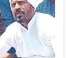
బీజేపీ నేత శాశి కళాపాలం