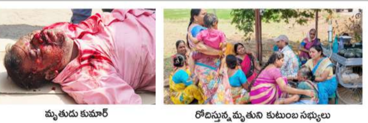
మృతుడు కుమార్ రోడ్డుపై మృతుని కుటుంబ సభ్యులు

పెద్దపల్లి జిల్లా, అంతర్గాం మండలం, ముర్కూరు మట్టి దొంగల దాహానికి నిండు జీవితం బలియింది. హెల్మెట్ నడచి నిబంధనలన్నీ పాటించి వెళ్తున్నాడని తెలుసుకున్న పట్టిదొంగల వచ్చిన మట్టిదొంగ డ్రీకొని ముందే గమనించిన ప్రముఖ రాజకీయ నేతలు, సామాజిక వాదులు స్థానిక ఎమ్మెల్యే మొదలు జిల్లా కలెక్టర్ వరకు ఎన్నో ఫిర్యాదులు చేశారు. బాధ్యులు అవేపి పట్టించుకోవాలంటే జరగాల్సిన నష్టం జరిగిపోయింది. విధులకోసం వెళ్లి తిరిగిస్తాడనుకున్న మృతుని భార్య, ఇద్దరు పిల్లలకు నిర్జీవ దేహమే మిగిలింది.