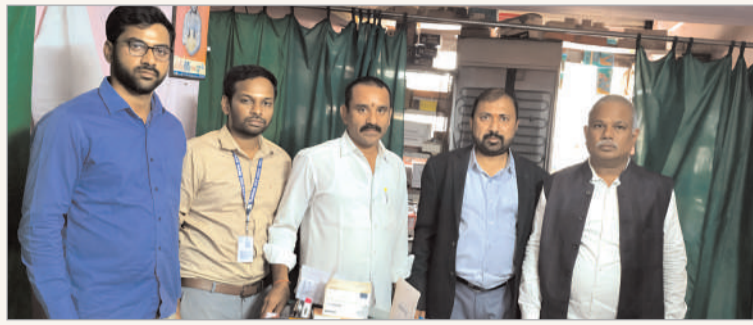
ఉమ్మడి ఆదిలాబాద్ బ్యూరో, మార్చి 18 (నినాదం):

• తెలియనివ్యాధికి, అడ్డగోలు మాత్రలు • అవసరపు మందులతో కొత్త సమస్యలు • దోపిడీ లక్ష్యంగా గ్రామీణ ప్రాంత వైద్యులు • పలు ఫిర్యాదులు, మెడికల్ కౌన్సిల్ దారులు