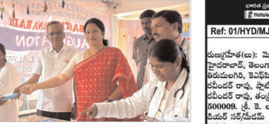
విద్యార్థులకు కంటి పరీక్షలు నిర్వహించే పథకం కార్యక్రమం ద్వారా కంటి పరీక్షలు నిర్వహించబడింది.