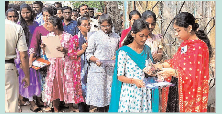
గాంధీనగర్ ప్రభుత్వ జూనియర్ కళాశాల వద్ద హోటింగ్ పరిశీలనకు సిబ్బంది

గోదావరిఖని, మార్చి 21 (నినాదం న్యూస్): శుక్రవారం మొదలైన పదవతరగతి వార్షిక పరీక్షలు గోదావరిఖని పారిశ్రామిక ప్రాంతంలో ప్రశాంతంగా ముగిసాయి. మొదటిరోజు కావటంతో నగరంలోని పలు పాఠశాలలకు చెందిన విద్యార్థులు నిర్ణీత సమయానికి గంటముందే సెంటర్ల వద్దకు చేరుకున్నారు. ఈ క్రమంలో పరీక్ష ఉదయం 9.30 కు మొదలై మధ్యాహ్నం 12.30కు ముగిసింది. కాగా రామగుండం కమిషనరేట్ పోలీసులు ప్రతి పరీక్షా కేంద్రం వద్ద గట్టి బందోబస్తు నిర్వహించారు. విద్యార్థులకు ఉన్నతాధికారులు 164 మంది ఇన్విజిలెటర్లను నియమించగా, రామగుండం మండలంలోని మొత్తం 10 సెంటర్లకు గానూ, 2032 మంది విద్యార్థులు పరీక్షలు రాసారు. ఎంద