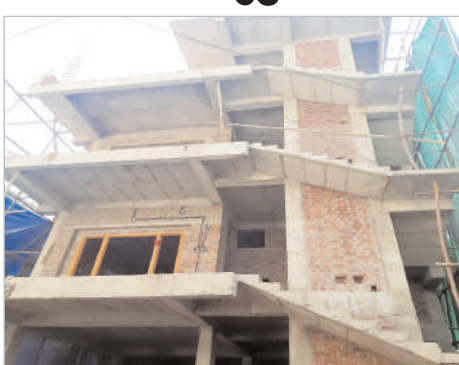
అటువైపు కన్వెయిన్ కుడా చూడడం లేదని విమర్శలు వినిపిస్తున్నాయి. పైస్థాయి అధికారులకు తెలిసినా చూసి చూడనట్లు వ్యవహరిస్తున్నారని ప్రజలు ఆగ్రహం వ్యక్తం చేస్తున్నారు. ఇప్పటికైనా జీహెచ్ఎంసీ ఉన్నతాధికారులు చొరవ తీసుకొని అక్రమ నిర్మాణాలపై చర్యలు తీసుకోవాలని స్థానిక ప్రజలు కోరుతున్నారు.

అల్వాల్, మార్చి 21 (నినాదం న్యూస్): మల్కాజ్ గిరి నియోజకవర్గం అక్రమ నిర్మాణాలకు అడ్డాగా మారింది. ఎక్కడ చూసిన అక్రమ నిర్మాణాలు పలుకుతున్నాయి. దీంతో జీహెచ్ఎంసీకి రావాల్సిన కోట్ల రూపాయలు ఆదాయానికి గండి పడుతుంది. ఆసంద్ బాగ్ పోస్ట్ ఆఫీస్ పక్కనే అనుమతులకు విరుద్ధంగా అక్రమ నిర్మాణాలు జరుగుతుండగా.. నోటీసులు ఇచ్చి అధికారులు చేతులు దులుపుకుంటున్నారు. (పైమ్ విజయవగర్ కాలనీ తదితర ప్రాంతాలలో అక్రమ నిర్మాణాలు నిర్మిస్తున్నారు. నామమాత్రంగా జి-ప్లస్-1 పర్మిట్ తీసుకొని సెట్ బ్యాక్ లేకుండా నాలుగు ఫోర్డు వేసి పెంట్ చూసి నిర్మాణాలు చేపడుతున్నారు. ఇంటి యజమానులతో టౌన్ ప్లానింగ్ అధికారులు కుమమై