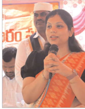
బరువు ఉండడం వంటి అంశాలను

నిర్వహణపై మహిళలకు అవగాహన వచ్చిందని, తద్వారా చిన్నారులు లోప పోషణ, మహిళల్లో రక్తపోషణ తగ్గు ముఖం పడుతోందని అన్నారు. మహిళలు ఆరోగ్యంగా ఉంటేనే కుటుంబం ఆరోగ్యంగా ఉంటుందన్న ఆలోచనతో ఈ కార్యక్రమం నిర్వహిస్తున్నామని అన్నారు. కొత్తరకుంట గ్రామంలో 71 మంది చిన్నారులు ఉండగా కేవలం ఆరుగురు పిల్లలకు మాత్రమే లోప పోషణ ఉందని తెలిపారు. వారిని కూడా సాధారణ ప్రిథికి తెస్తామని తెలిపారు. శ్రీకృష్ణారం సభ ద్వారా సాధారణ ప్రసవాల పట్ల మహిళలకు అవగాహన పెరిగిందని అన్నారు. తమ పిల్లల లోప పోషణ, ఎత్తుకు తగిన