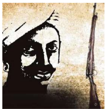
మార్చి 29... మంగళ పాండే బ్రిటిష్ సైనికాధికారిని కాల్చి చంపిన రోజు

బ్రిటిష్ రాచరిక నిరంకుశ పాలనను, పక్షపాత ధోరణిని, పంటి బురుగు భరిస్తూ, ఎదురించలేక, తలవంచుకుని బానిసలుగా బతుకుతున్న భారతీయుల నిన్నుత్తుకు మాత్రం శక్తిని ప్రసాదించి, ఆలోచనలను స్వేచ్ఛాస్వాతంత్ర్యాల వైపుకు మళ్లించిన స్వేచ్ఛా ప్రయత్నం మంగళ పాండే. మూడు పదుల వయసు చూడకుండానే ప్రాణ త్యాగానికి సిద్ధపడి, ఉరి కంటాన్ని ముద్దాడిన యువ కిషోరిని పాండే. 1857 నాటికి యాభయైతేనే తన అధినేతలకి తప్పకుండా బ్రిటిష్ పాలకుల ఆజ్ఞలను ధిక్కరించి - ఆ కొనసాగే నిపాయిలు తిరుగుబాటుగా చరిత్ర పుటల్లో నిలిచిన. ప్రత్యేక స్వాతంత్ర్య సంస్థాపనకు బీజం వేసి, ధిక్కార స్వరాన్ని వినిపించి, సంస్థాపనకి మినీసాని, మొక్కువని వైద్య సాహాయాలను ప్రదర్శించి, భారత జాతికి మూర్ధుర్యులు కునిగా నిలిచిన మేరు నగ ధీరుడు మంగళ పాండే.