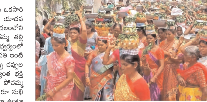
బోనాలను సమర్పించి ప్రత్యేక పూజలు చేశారు. గ్రామంలోని యాదవ కులస్తులు ఆధ్వర్యంలో జరిగిన పోచమ్మ తల్లి బోనాలకు కుటుంబ సభ్యులందరూ తరలిరావడంతో పండుగ వాతావరణం కనబడింది.

జమ్మికుంట, మార్చి 28 (నినాదం న్యూస్): బరు సంవత్సరాలకు ఒకసారి జరుపుకునే పోచమ్మ తల్లి బోనాల పండుగను కోరపల్లి యాదవ కులస్తులు ఘనంగా నిర్వహించారు. జమ్మికుంట మండలంలోని కోరపల్లి గ్రామంలో యాదవ సంఘం ఆధ్వర్యంలో పోచమ్మ తల్లి బోనాలను ఘనంగా నిర్వహించారు. యాదవ కులస్తులు ఆధ్వర్యంలో బరు సంవత్సరాలకు ఒకసారి జరిగే బోనాల సందర్భంగా ప్రతి ఇంటి గడప నుండి పోచమ్మ తల్లి బోనాలను నెత్తిన పెట్టుకొని డప్పు చప్పుల మధ్య సృష్ట్యాలు చేస్తూ వందలాది మంది మహిళలు అత్యంత భక్తి శ్రద్ధలతో బోనాలను సమర్పించి మొక్కులు చెల్లించుకున్నారు. పోచమ్మ తల్లి బోనాలను నిర్వహించడం వల్ల గ్రామంలోని ప్రజలందరూ సుఖి క్రంగా ఉండడంతో పాటు పాడివంటలతో రైతులు ఆనందంగా ఉంటారని భక్తుల ప్రగాఢ విశ్వాసం. మహిళల స్వస్థాలు డప్పు చప్పుల మధ్య డిజై సాంగ్ లతో సృష్ట్యాలు చేస్తూ గ్రామంలో నడిబోడున కొలువుదీరిన భోజులక్షి గ్రామదేవతలకు మొక్కులు చెల్లించుకుని పోచమ్మ తల్లికి