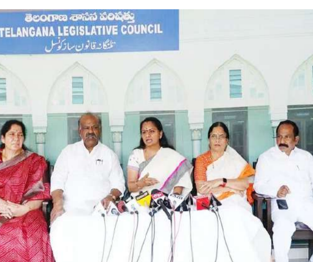
నికీ బీఆర్ఎస్ పార్టీ కృషి ఫలితం ఎంతో అసభ్యంగా మాట్లాడారని, ఆ వ్యాఖ్యలు ఉండవచ్చు. అసెంబ్లీ నాక్షిక్ మహిళలను అయిన చరిత్రలో మరకా ఉండిపోతాయని ఉద్దేశించి పరుష పదజాలంతో ముఖ్యమంత్రి అన్నారు.

తూనే ఉంటామని చెప్పారు. ఏప్రిల్ 27న ఎల్లూరు వద్ద బీఆర్ఎస్ పార్టీ రజతోత్సవ సభ జరుగుతుందని ఆమె తెలిపారు. మహా కుంభమేళా తరహాలో సభను నిర్వహిస్తామని అన్నారు. ఇరవై బడు వసంతాల బీఆర్ఎస్ పార్టీ ఉత్సవాల్లో ప్రజలు పెద్దపాత్రను పోషించాలని కవిత పోషించాలని అన్నారు. శాసనసభలో బీఆర్ఎస్ ప్రజల గౌరవంగా వ్యవహరించిన అన్నారు. సమన్వయంతో అన్ని అవకాశాలను వాడుకోని ప్రభుత్వాన్ని ప్రశ్నించామని, అన్ని చర్యల్లో పాల్గొని కాంగ్రెస్ ప్రభుత్వ వైఖరీలు మారుతూ ఉంటున్నాయని కవిత చెప్పారు. మండ్ల సమావేశాలు రాష్ట్ర చరిత్రలో నిలిచిపోతాయని, ఈ సమావేశాల్లోనే బీసీ రిజర్వేషన్లు వచ్చి బిల్లులు, ఎన్ని పద్ధతీల బిల్లు ఆమోదం పొందాయని తెలిపారు. ఆ బిల్లుల ఆమోదా