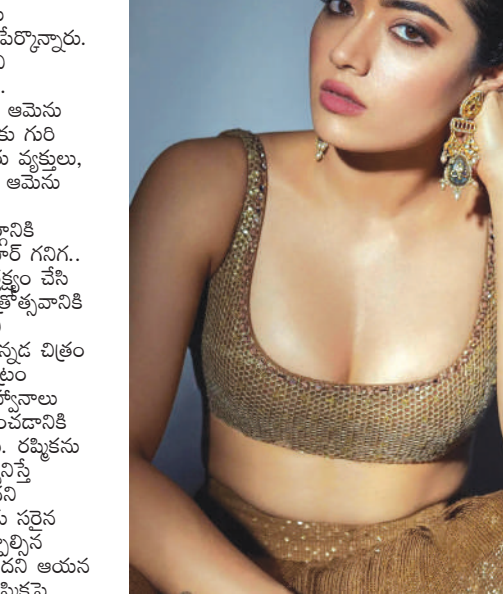
కోరాడు నాచప్పు, రష్మిక ఇప్పటివరకు ఈ వివాదంపై ఎలాంటి స్పందన ఇవ్వలేదు. అయితే, సోషల్ మీడియాలో మాత్రం ఆమెకు మద్దతుగా అభిమానులు పెద్ద ఎత్తున కామెంట్లు చేస్తున్నారు.

కొడవ హక్కుల పరిరక్షణ సంస్థ కొడవ నేషనల్ క్యాంపెన్ నటి రష్మిక మందన్న భద్రతపై తీవ్ర ఆందోళన వ్యక్తం చేసింది. కొనసాగుతున్న రాజకీయ వివాదాల మధ్య ఆమెకు భద్రత కల్పించాలని కేంద్ర, కర్ణాటక హోం మంత్రులను కోరింది. నటి రష్మిక మందన్న కర్ణాటకలోని కొడవ కమ్యూనిటీకి చెందినవారు. ఆమె జేన్ కోడగు ప్రాంతం. ఆమె కొడవ వారసత్వం కారణంగా నటిని అన్యాయంగా లక్ష్యంగా చేసుకున్నారని ఆరోపించింది. కాంగ్రెస్ ఎమ్మెల్యే రవి గనిగ నటిపై తీవ్ర విమర్శలు చేసిన నేపథ్యంలో ఈ ఆభయనం చేసింది. రష్మిక కృషి, ప్రతిభతో గొప్ప పేరు తెచ్చుకుంది. కొందరు భయభ్రాంతులకు గురి చేస్తున్నారు.. ఆమెను అనవసరమైన రాజకీయ