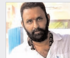
అమరావతి, మాధ్యమిక(నినాదం న్యూస్): మాజీ మంత్రి, వైసీపీ నేత కొడాలి నాని మెరుగైన చికిత్స కోసం ముంబైకి తరలించారు. కొద్దిరోజుల క్రితం కొడాలి నాని తీవ్ర అనారోగ్యానికి గురైన విషయం తెలిసింది. ఈ ఐదు రోజులూ హైదరాబాద్ లోని ఓ ప్రైవేటు- ఆస్పత్రిలో ఆయన చికిత్స పొందుతున్నారని, గుండెకు సంబంధించిన సమస్యతో మాజీ మంత్రి బాధపడుతున్నారని. ఈ క్రమంలో మెరుగైన వైద్యం కోసం కుటుంబసభ్యులు ఆయనను ప్రత్యేక విమానంలో ముంబైకు బయలుదేరి వెళ్లారు. మెరుగైన చికిత్స కోసం ముంబైకి తరలించినట్లు చెబుతున్నప్పటికీ గుండె సంబంధిత వ్యాధితో పాటు ఇతర ఆరోగ్య సమస్యలు కూడా ఉన్నట్లు సమాచారం. హైదరాబాద్ లోని ఎంజీ ఆస్పత్రిలో జీర్ణకోసం సంబంధిత వ్యాధితో నాని చేరారు. అయితే ఆయనకు గుండె సంబంధిత వ్యాధి ఉన్నట్లు వైద్యులు నిరాశించారు. గుండెకు సంబంధించి మూడు వారాల్ని పూరుకుపోయినట్లు తెలుస్తోంది. మాజీ సీఎం జగన్.. హైదరాబాద్ లోని ఆస్పత్రి వైద్యులతో మాట్లాడిన సమయంలో ఈ విషయాన్ని తెలియజేశారు. దీనిపై హైదరాబాద్ లోని ఆస్పత్రిలో ప్రయోగాలు చేసినప్పటికీ సవలీకృతం కాకపోవడంతో ఆయనను వెంటనే ఎయిర్ అంబులెన్స్ తో ముగ్గురు డాక్టర్ల పర్యవేక్షణలో హైదరాబాద్ నుంచి ముంబైకి తరలించారు. చాలా యాక్టివ్ గా ఉన్న నాని.. ఆ తరువాత జీర్ణకోసం సంబంధిత వ్యాధి ఉండవలసి హైదరాబాద్ లోని ఆస్పత్రిలో చేరారు. అయితే కొడాలి నాని హృదయ పరీక్షించిన వైద్యులు.. ఆయన గుండె సంబంధిత వ్యాధితో బాధపడుతున్నట్లు గుర్తించారు. వెంటనే సర్జరీ చేయాలని భావించారు వైద్యులు. అయితే సర్జరీ క్లియర్ గా మారడంతో మెరుగైన చికిత్స నిమిత్తం ముంబైకి తరలివచ్చిన వైద్యులు సూచించారు. దీంతో ఆయనను ప్రత్యేక ఎయిర్ అంబులెన్స్ తో సోమవారం ముంబైకి తరలించారు.