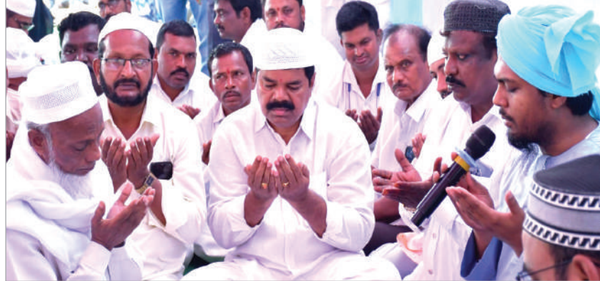
రంజాన్ వేడుకలు సోమవారం ఘనంగా నిర్వహించారు. నిన్న వేసవకున్న హాసీన్ ముస్లిం సోదరులందరూ ఈరోజు సాంప్రదాయబద్ధంగా రంజాన్ వేడుకలు అన్ని దర్గాల్లో ఘనంగా నిర్వహించారు. రం