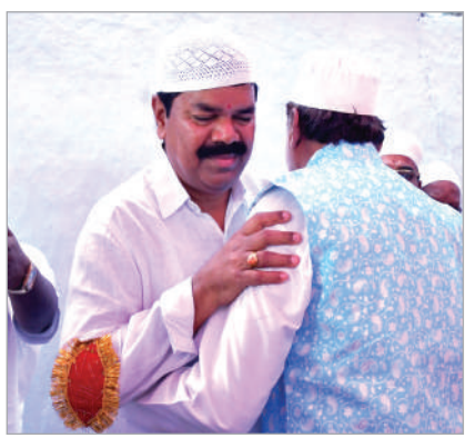
ముఠాగారు హల్దీ 31 (నినాదం స్టూన్) : ముఠాగారు మండలంలో అన్ని ముస్లిం దర్గాల్లో