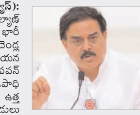
విశాఖపట్టణం, మాధ్యమిక(నినాదం న్యూస్): యువత కోసం డిప్యూటీ సీఎం పవన్ కల్యాణ్ తపన్ పడుతున్నారని, ఉత్తరాంధ్రకు భారీ పెట్టుబడులు వస్తాయని మంత్రి నాదెండ్ల మనోహర్ తెలిపారు.. విశాఖపట్టణంలో ఆయన మాట్లాడుతూ.. ఉపముఖ్యమంత్రి పవన్ కల్యాణ్ కు ఉత్తరాంధ్ర యువతకు ఉపబిడ్డ కల్పించాలని తపన్ పడుతున్నారని.. ఉత్తరాంధ్రకు భారీ స్థాయిలో పెట్టుబడులు వస్తాయనే నమ్మకాన్ని వ్యక్తం చేశారు.. దీనిని పథకం -2, లో భాగంగా 99 లక్షల మంది అభివృద్ధి కలిపి అందించాము. గతంలో ఎప్పుడు లేని విధంగా ధాన్యం కొనుగోలు చేసి 24 గంటలలో రైతులకు డబ్బాలు అందించాం.. మారుమూల గ్రామాలకు రోడ్డు సౌకర్యం కల్పిస్తున్నాం.. పవన్ కల్యాణ్ గిరిజన గ్రామాలలో పర్వతాన్ని దోర్లకు శంకుస్థాపన చేసిన విషయాన్ని గుర్తు చేశారు. ఇక, జనసేన పార్టీ ఎమ్మెల్యేలు ఉన్న నియోజకవర్గాలలో అభివృద్ధి, సంక్షేమం అందించడానికి ప్రణాళిక తయారుచేసుకున్నాం అన్నారు నాదెండ్ల మనోహర్.. హైదరాబాద్ జనసేన ఆవిర్భావం సభ విజయంతో అయిందన్న ఆయన.. సభ విజయంతో చేయడానికి కృషి చేసిన ప్రతి ఒక్కరికీ పేరు పేరునా సరఫరాచేయాలని తెలిపారు.. అన్ని స్థాయిల్లో కమిటీలు ఏర్పాటు-కు ప్రణాళికలు సిద్ధం చేస్తున్నాం.. టీడీపీ, బీజేపీతో కలిసి ప్రజలు కోసం అంకితభావంతో జనసేన నాయకులు పనిచేయాలని సూచించారు.. గత ప్రభుత్వంలో విశాఖపట్టణంలో లాండ్ అడర్ సమస్య సృష్టించారు. యుజికొందలో ప్రజాభయంతో ప్యాల్సని నిర్మించారు. విశాఖలో భూజిల్లాలకు పాల్గొన్నారు, మామరంబం విద్వేషం చేశారని మంత్రి నాదెండ్ల మనోహర్ మండిపడ్డారు.. కాని లభిస్తున్న లక్ష్యంగా కూలమి ప్రభుత్వం పనిచేస్తోందన్నారు.