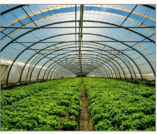
గ్రీన్ హార్వస్ట్ వ్యవసాయం అనేక అవకాశాలు:

ప్రస్తుతం మనదేశ జనాభా సుమారుగా నూట నలభై కోట్లకు పైగానే ఉంది. కానీ అనేక కారణాలవలన పంటభూమి విస్తీర్ణం రోజురోజుకీ తగ్గుతూనే ఉంది. దీని వలన అహార భద్రతకు ప్రాధాన్యత పెరుగుతోంది. సంప్రదాయ వ్యవసాయంలో అనిశ్చిత వర్షాలు, కరువులు, వరదలు, ఇతర వాతావరణ వైపరీత్యాల మూలన పంటల దిగుబడిని ప్రభావితం చేస్తున్నాయి. భూ వాతావరణంలో ఉష్ణోగ్రతలు పెరగడం వలన పంటల దిగుబడి తగ్గిపోతున్నది. వ్యవసాయానికి అవసరమైన నీరు లభ్యంకాక పంటలు ఎండిపోతున్నాయి. లోతుగా బోధించేయడం వలన భూగర్భ జలాలు ఇంకిపోతున్నాయి. రసాయన ఎరువులు, పురుగు మందులను అధికంగా వాడడంవలన నేల సారం క్షీణించిపోతుంది. దానితోపాటు పర్యావరణం కలుషితం అవుతుంది. నేల కోత వలన, పంటలను తెగుళ్లు, వ్యాధులు ఆశించడం వలన పంటల దిగుబడి తగ్గిపోతుంది. వ్యవసాయ కార్మికుల సంఖ్య తగ్గడం, వేతనాలు పెరగడం వలన పంట ఉత్పత్తి ఖర్చులు పెరుగుతున్నాయి. అందుకే వ్యవసాయ పద్ధతుల గురించి రైతులకు తగినంత అవగాహన ఉండడం లేదు. సాంకేతిక పరిజ్ఞానాన్ని ఉపయోగించడం వలన దిగుబడి పెరుగుతుందని రైతులకు తెలియదు. ఈ సవాళ్లను అధిగమించడానికి, రైతులు అధునక వ్యవసాయ పద్ధతులను అనుసరించాలి. ఇందులో గ్రీన్ హార్వస్ట్ వ్యవసాయం చెప్పుకోదగినది.